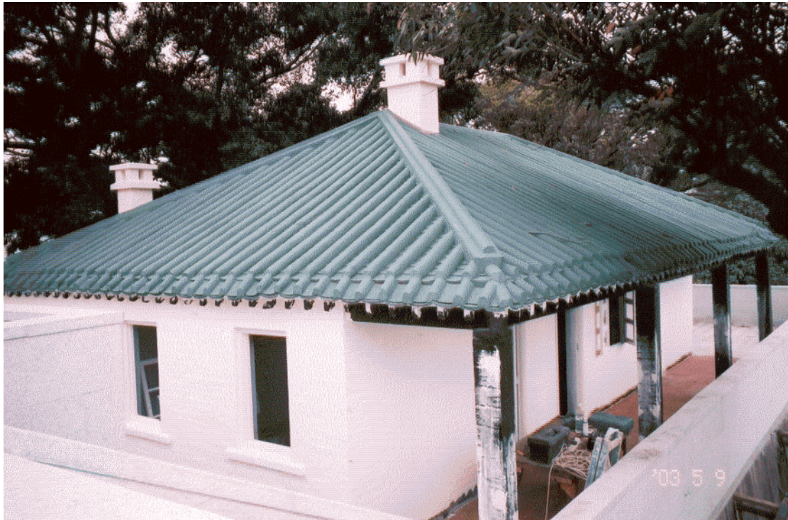
New Block and Toilet Block