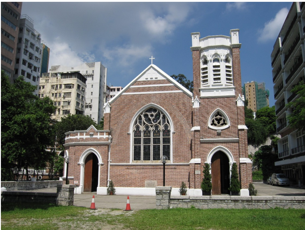
St. Andrew's Church