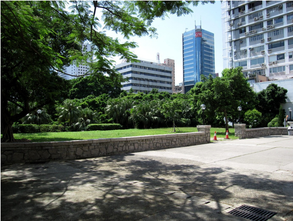
Landscaped Courtyard in front of the Church