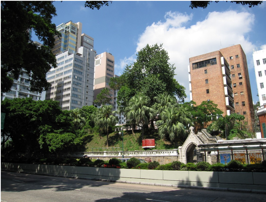
General View of the Church Compound from Nathan Road