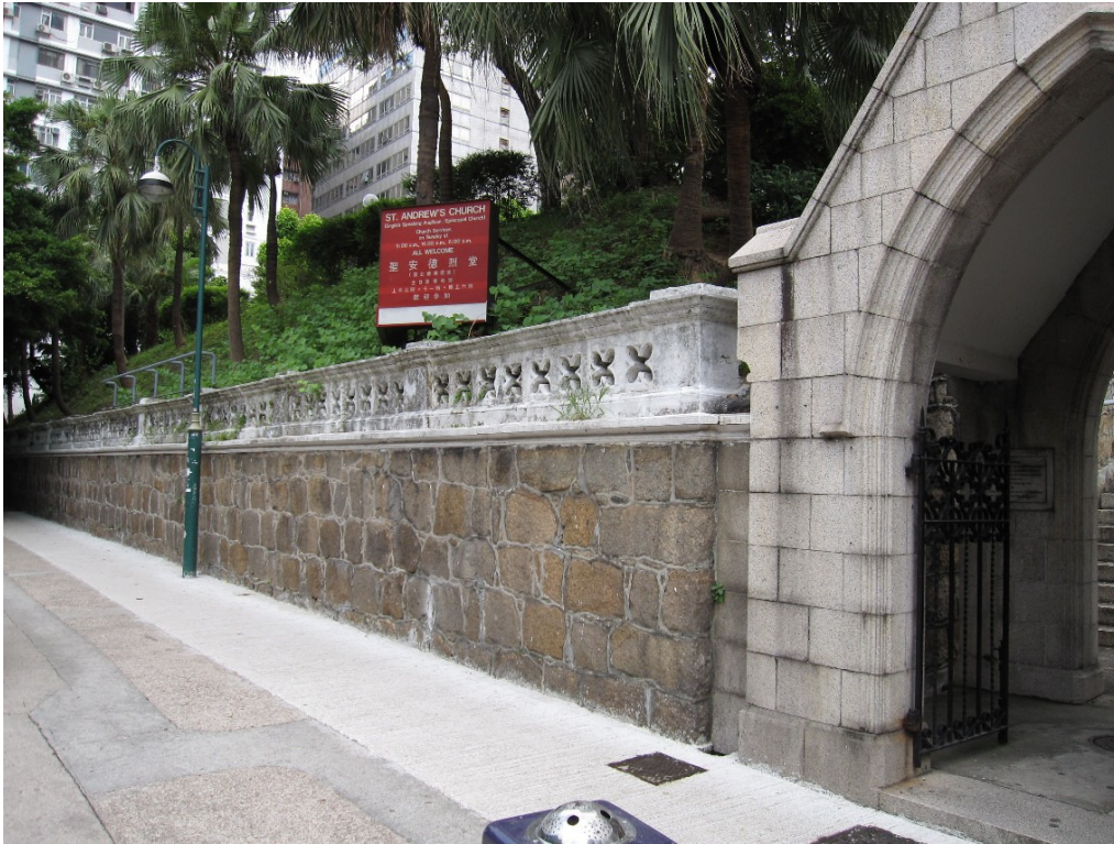
Rubble Wall, Decorative Parapet and Stone Gateway