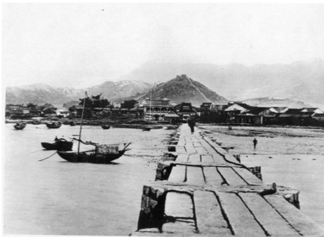
大約攝於一九一〇年的龍津橋照片