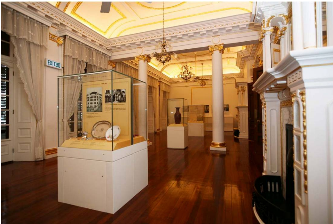
甘棠第地面高層的法式客廳