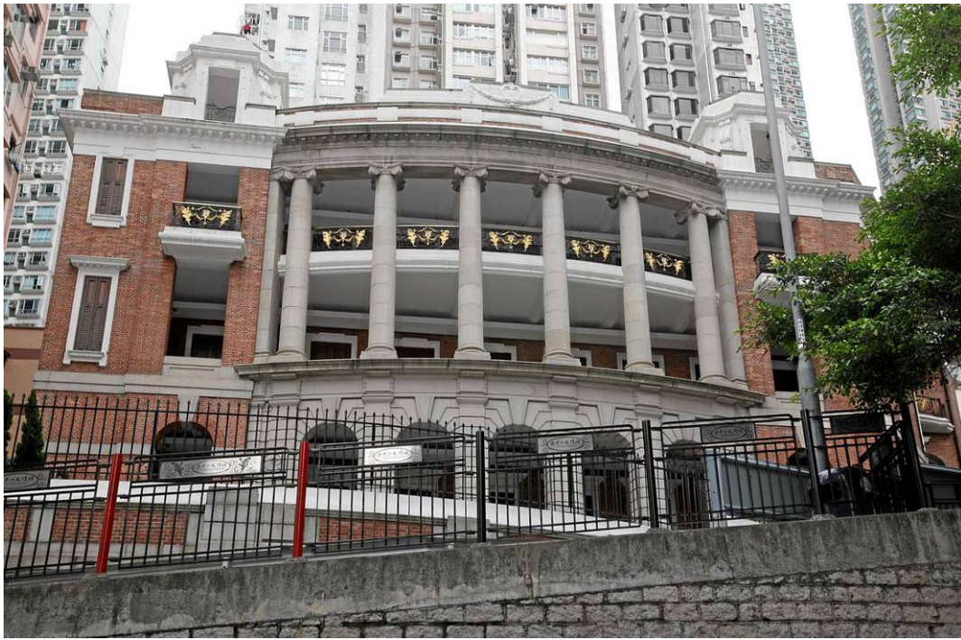
甘棠第面向堅道的正立面