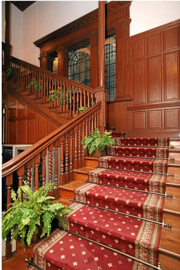
原有的柚木樓梯及其背後的彩色玻璃窗