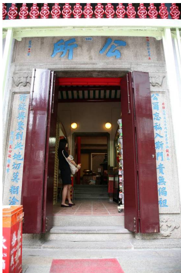
公所的花崗石門框甚具歷史價值