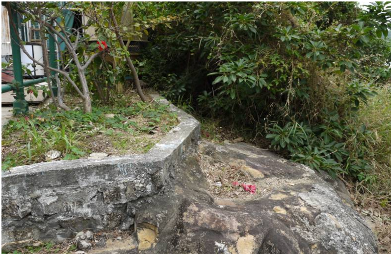
照片 8：移除部分植物後的花槽