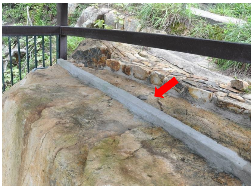
照片 1：石刻上方的水泥擋水堤