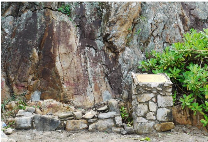
照片 6：拆除保護罩後的石刻