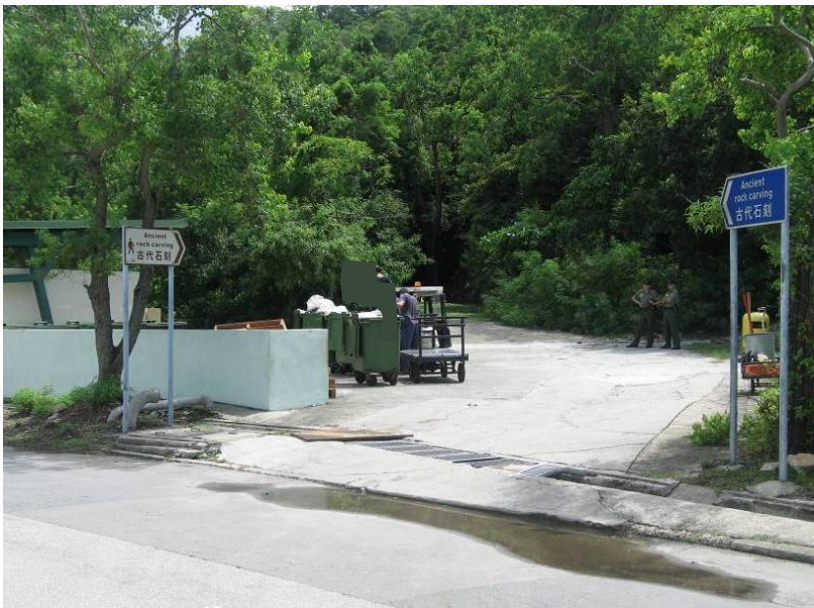
照片 4：清理垃圾收集站後的情況