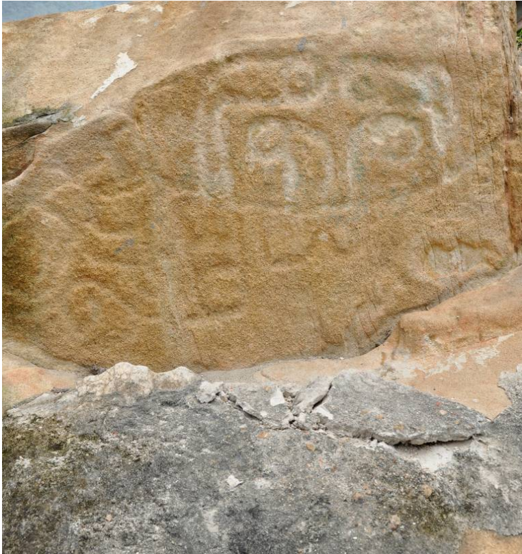
照片 10：覆蓋在石刻底部的水泥