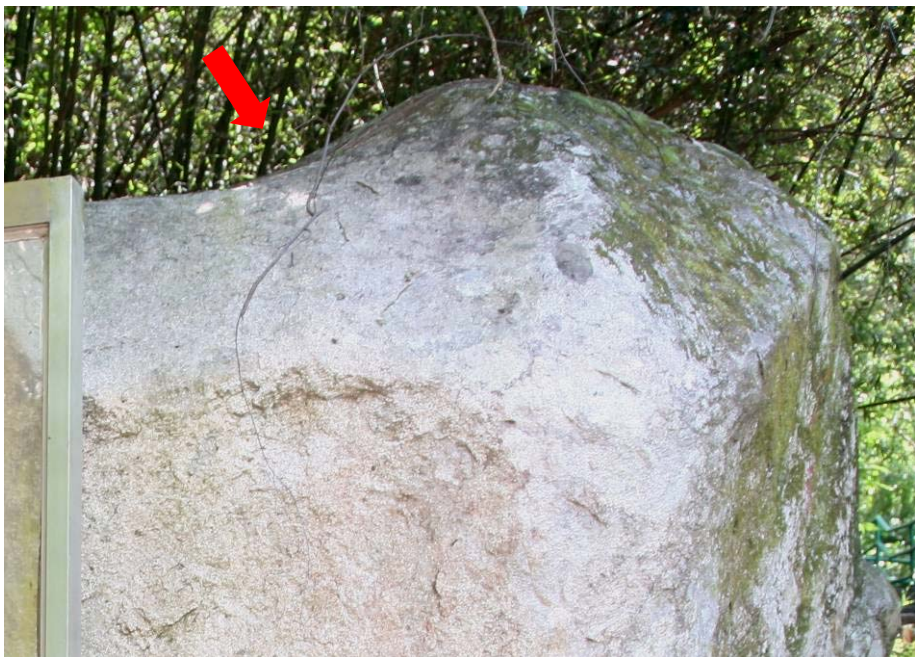
照片 15：拆除水泥擋水堤後的情況