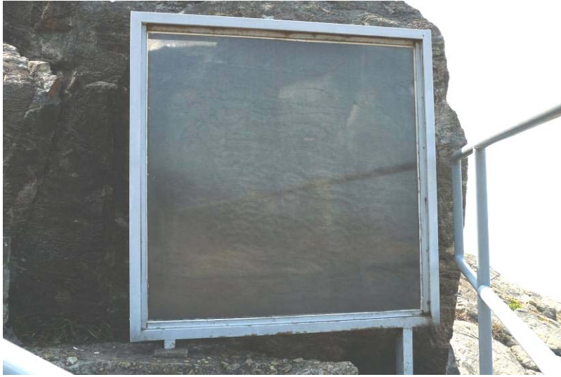
照片 12：石刻的保護屏幕