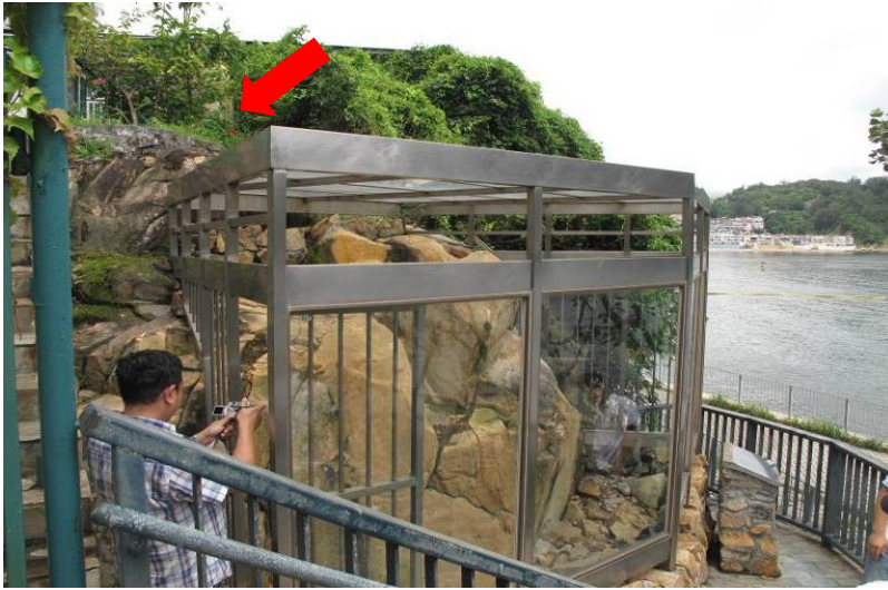
照片 7：石刻上方的花槽