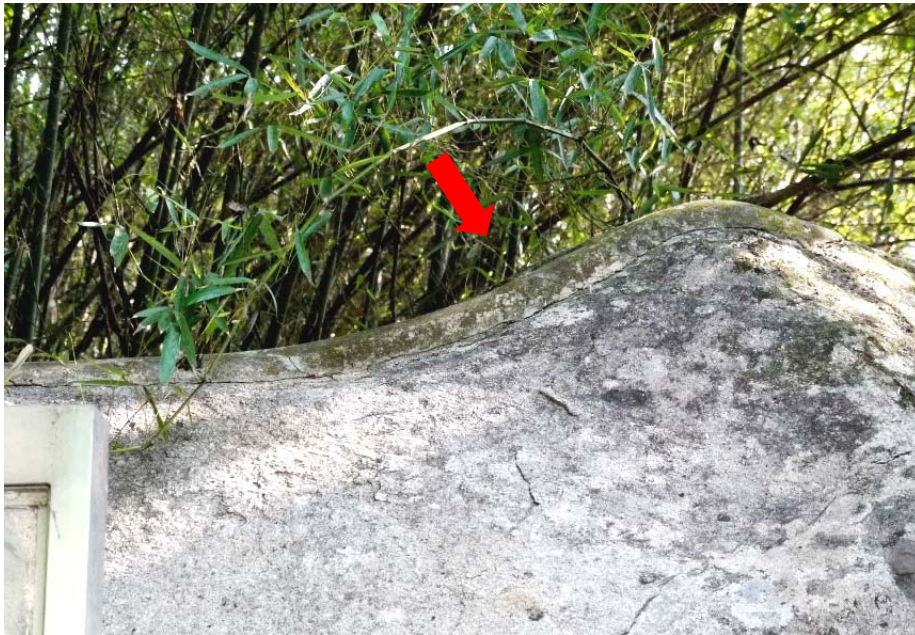
照片 14：刻石上方的水泥擋水堤