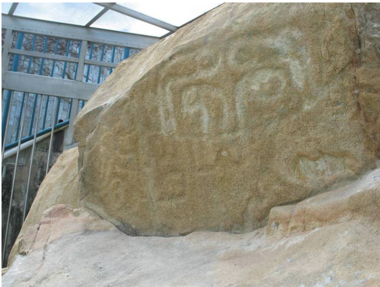
照片 11：移除水泥後的石刻