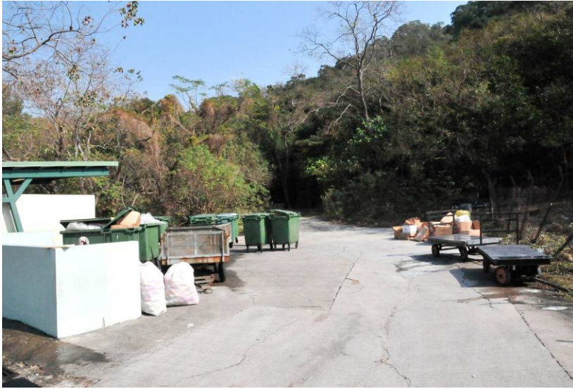
照片 3：通往石刻遺址的行人路上的垃圾收集站