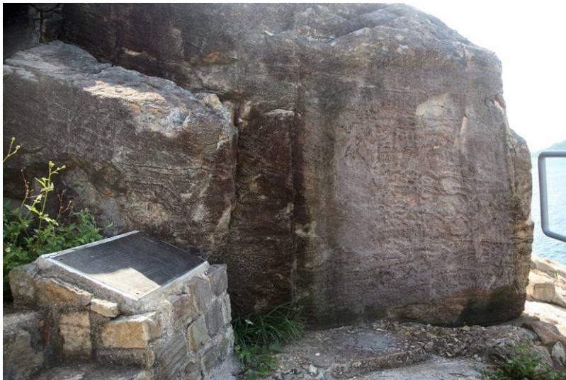
照片 13：拆除保護屏幕後的石刻