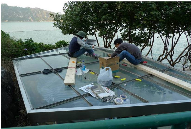
照片 9：重新封好玻璃上蓋，以防止雨水滲漏