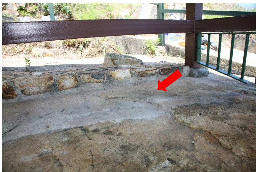
照片 2：拆除水泥擋水堤後的情況