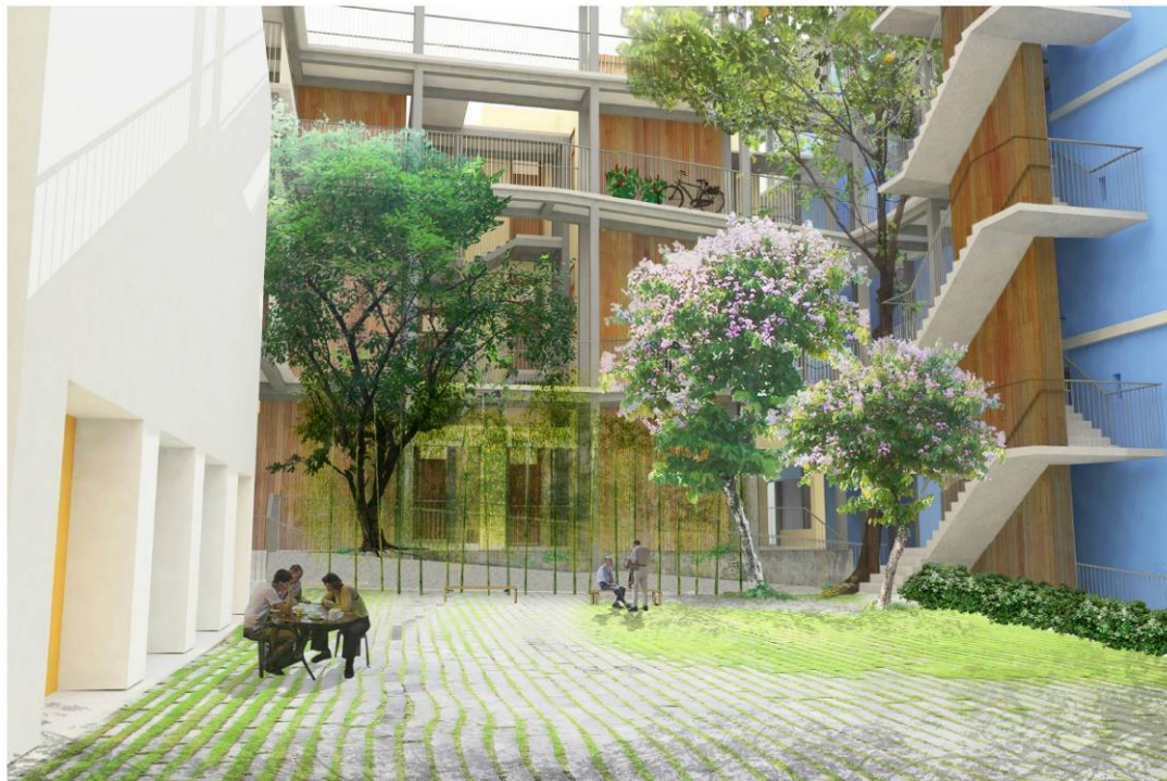
公共空間(庭園) Artist Impression (Courtyard)

Viva Blue House | Revitalization & Conservation We 嘩藍屋 | Proposal for Blue House Cluster