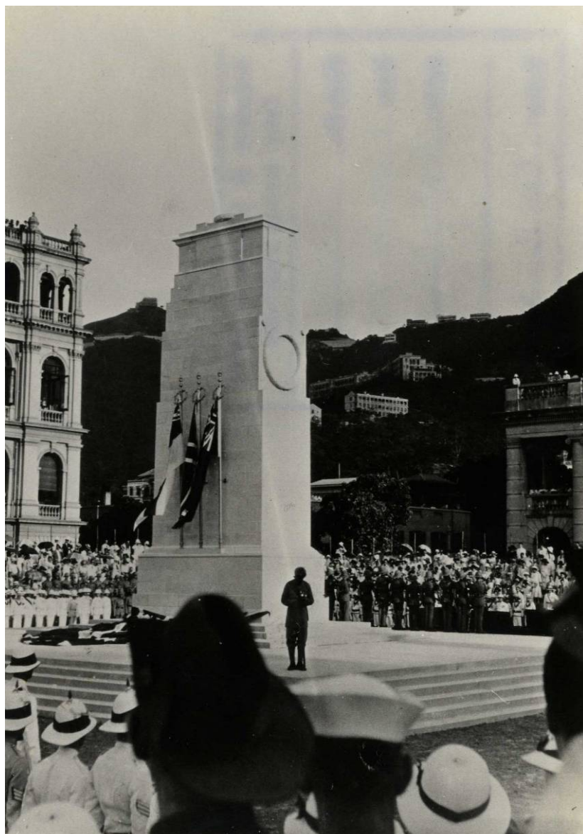
位於皇后像廣場的和平紀念碑 於一九二三年五月二十五日揭幕