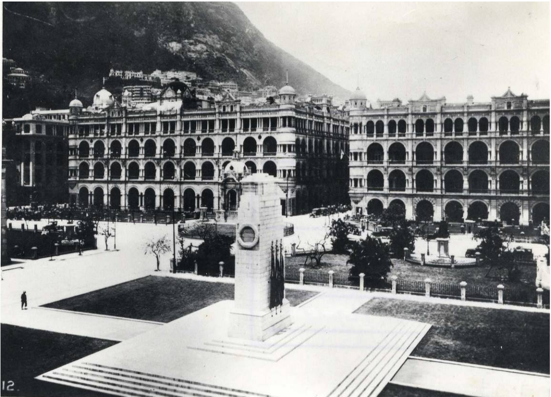
和平紀念碑位於皇后像廣場，背後為太子行及皇后行， 攝於約一九二五至一九三〇年