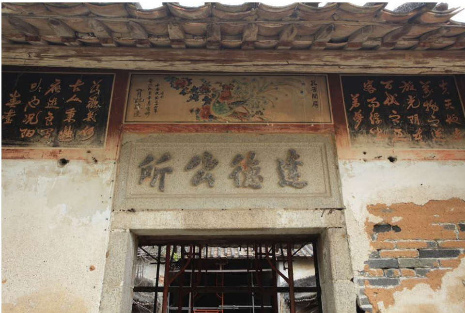
大門入口的花崗石額和壁畫依然完好無缺