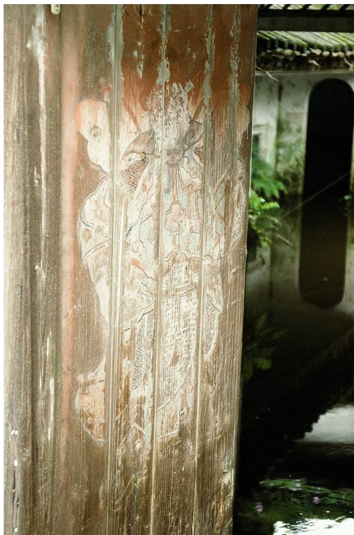
刻有門神的入口大門