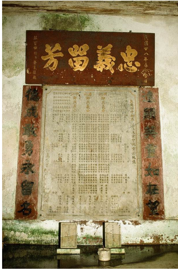
古蹟辦保存了公所內的紀念碑