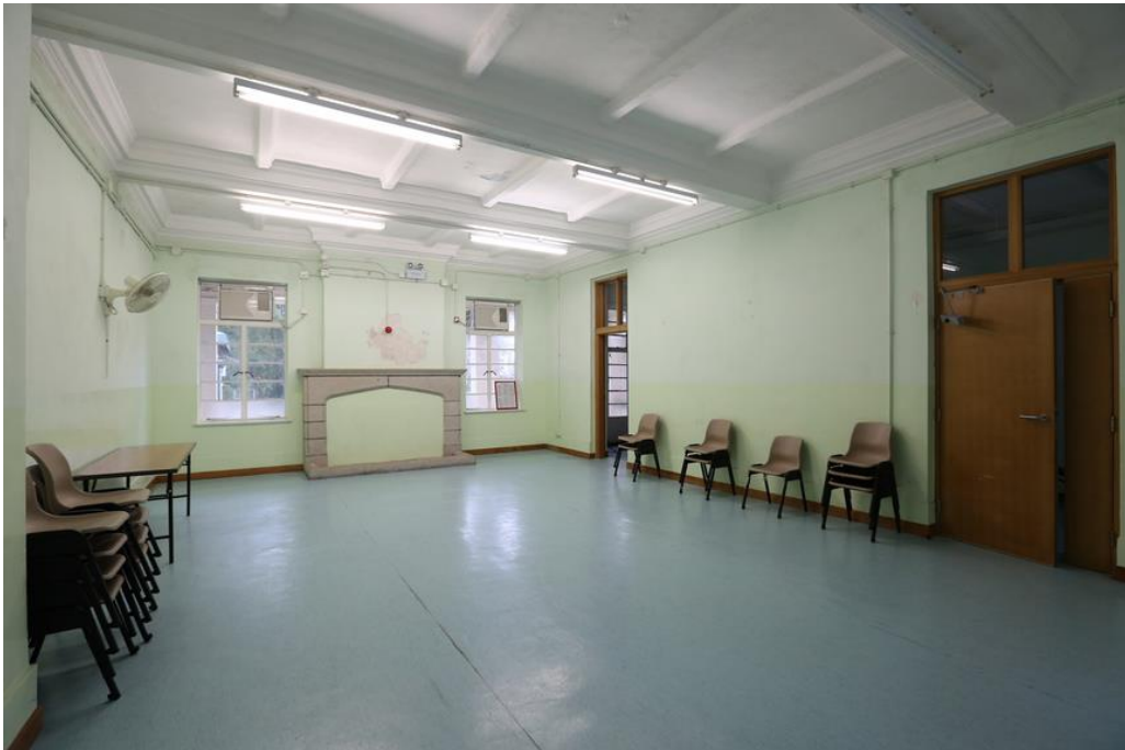
地下的舊飯廳及原有的花崗石壁爐。