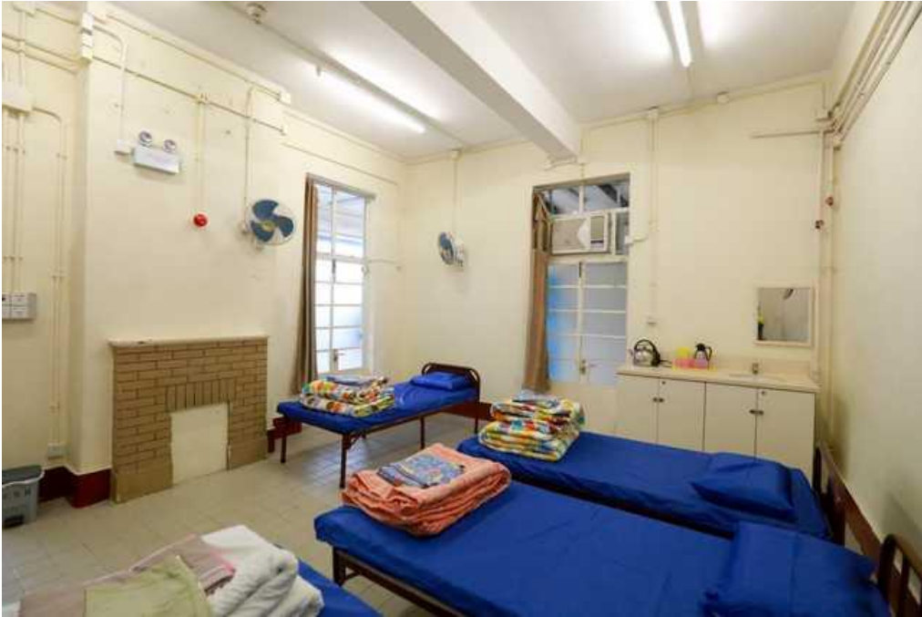
軍官的坐臥室現為營舍的家庭房。