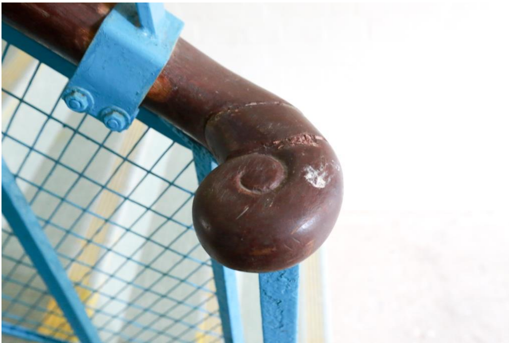
室內樓梯的卷形扶手端。