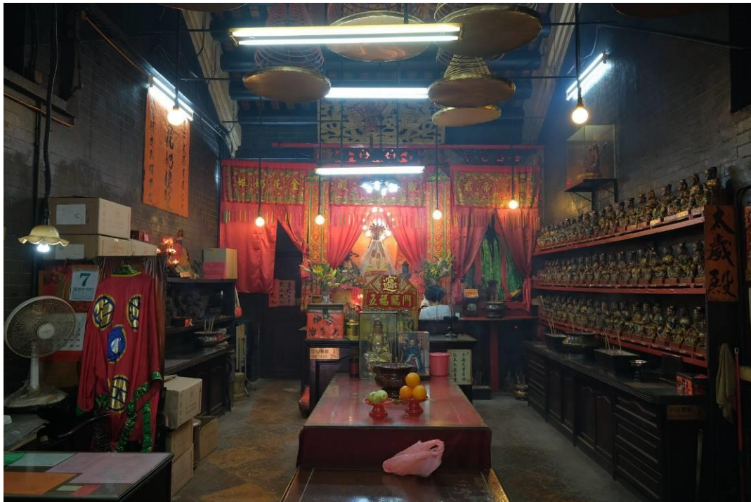
福德祠內部 主神壇供奉觀音、關帝及金花娘娘。