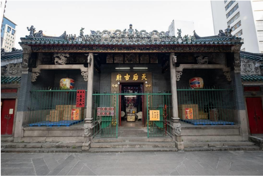
天后古廟正面 廟宇正脊飾有均玉店於一九一四年製造的石灣陶塑