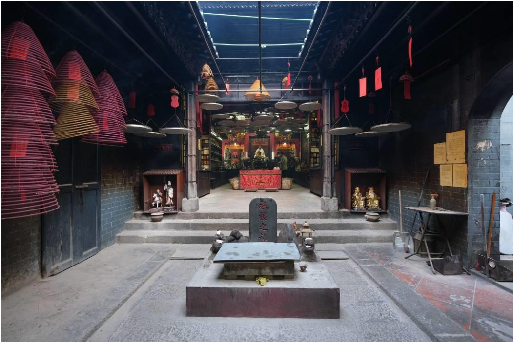
公所（現為觀音樓社壇）內部 天井中央設有社稷之神的神龕， 而後進明間則安放供奉觀音的神壇。