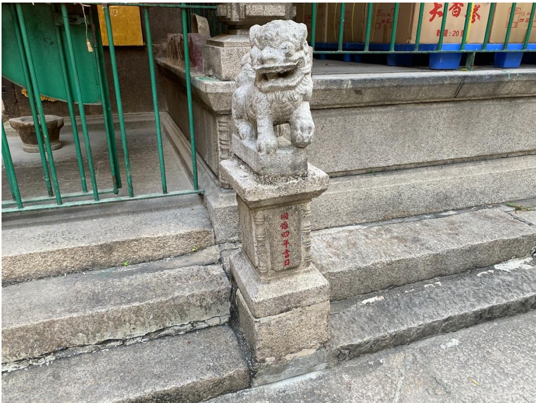
天后古廟前方的石獅上 刻有清朝「同治四年」（一八六五年）的年份