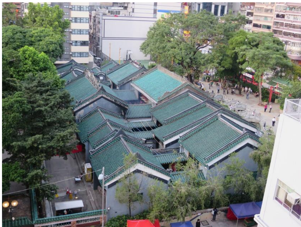
廟宇建築群鳥瞰圖