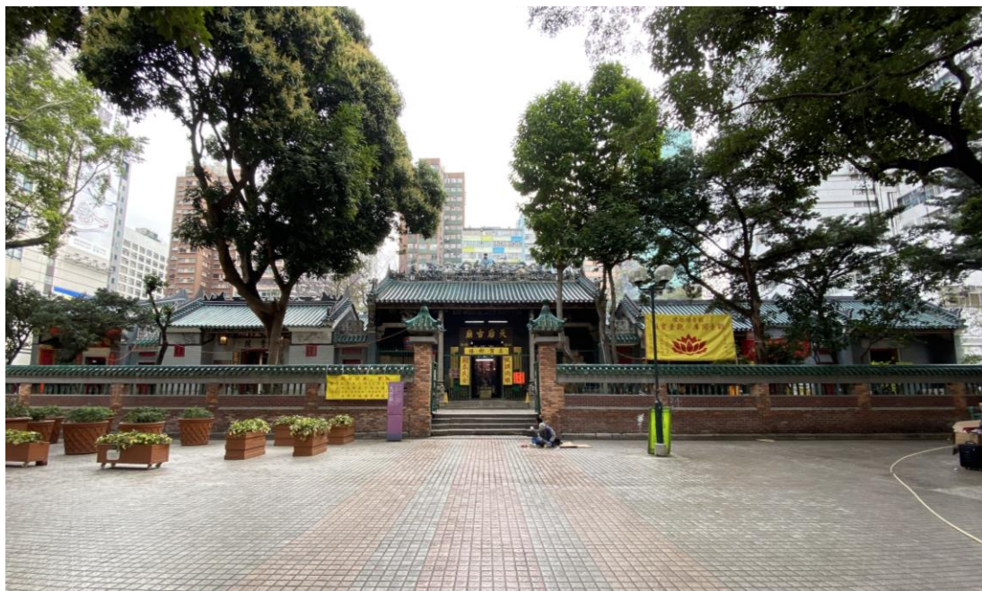
天后古廟及鄰接建築物正面