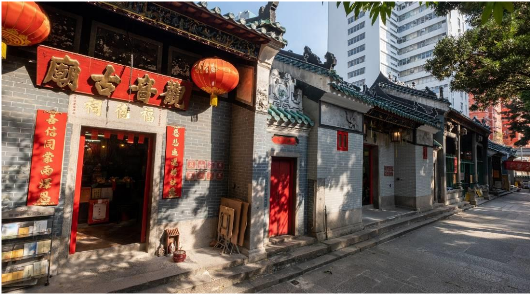
天后古廟、公所、福德祠及兩所書院等五座建築 建於一八七六年至一九二零年間