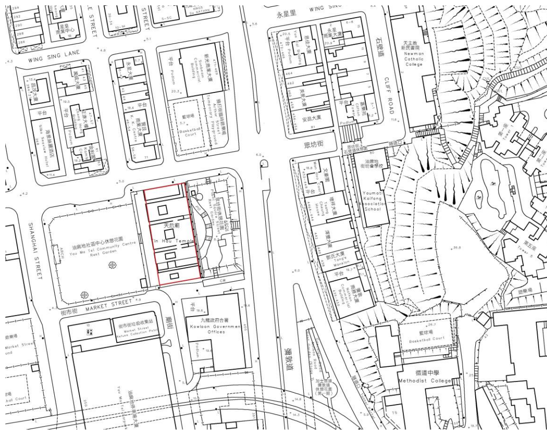
*圖中以紅線劃定的範圍為擬議古蹟範圍