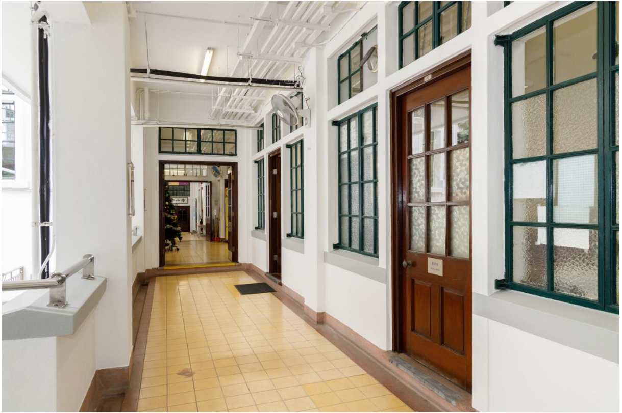
木門、帶花紋或普通玻璃鋼框窗戶及舊式小五金均保持完好。