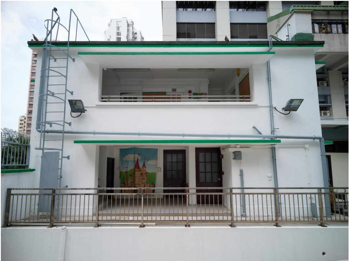
前工人宿舍樓高兩層，位於東邊街入口閘門附近。