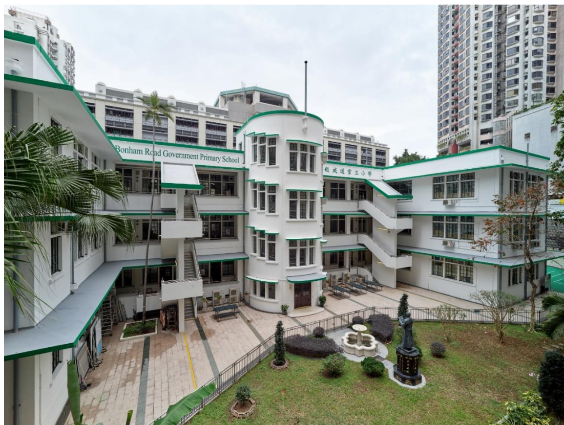
天台矮牆上有現時學校的中文名稱「般咸道官立小學」及英文名稱“Bonham Road Government Primary School”，可見是建築的正立面。