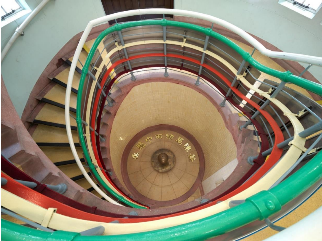
中央旋轉樓梯連意大利批盪飾面