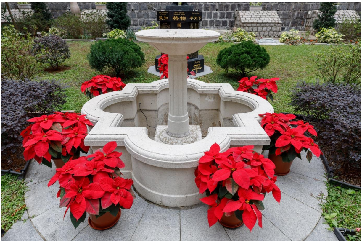
主樓前的花崗石噴泉