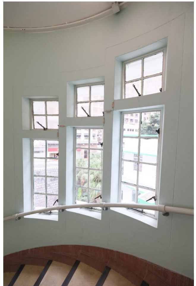
窗戶沿樓梯逐層向上而建，讓建築更富美感。