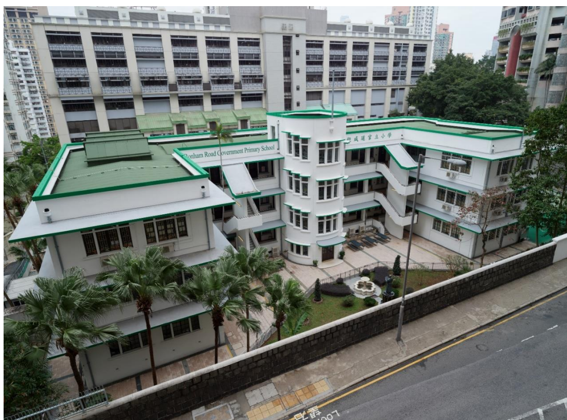
般咸道官立小學主樓鳥瞰圖，建築呈 E 字形布局，中間部分狹長，兩端各有附翼。