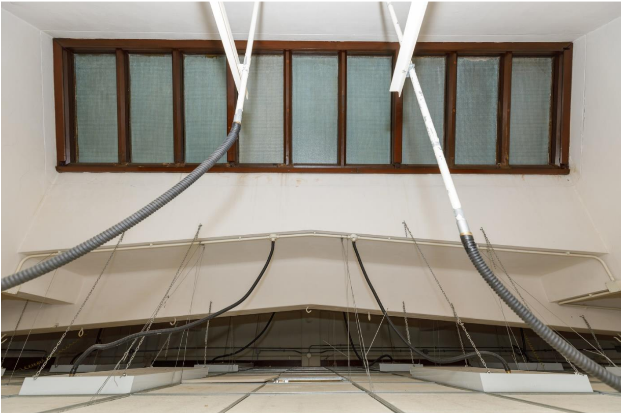
二樓美術室的假天花上方仍可看到金字橫樑及已圍封天窗的底部，天窗由木框及玻璃組成。