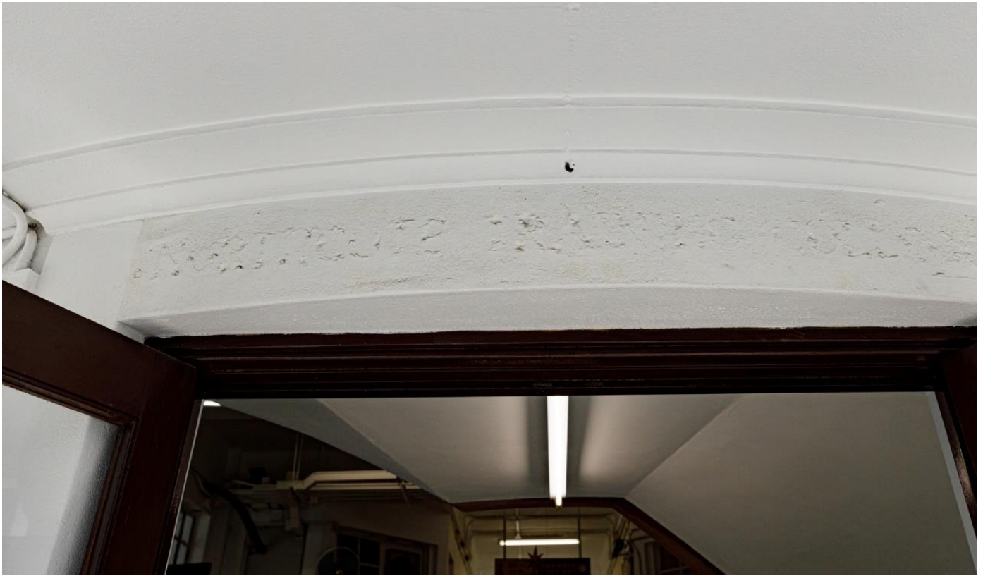
主樓南面外牆正門入口仍隱約看到「羅富國師範學院」名稱的痕跡