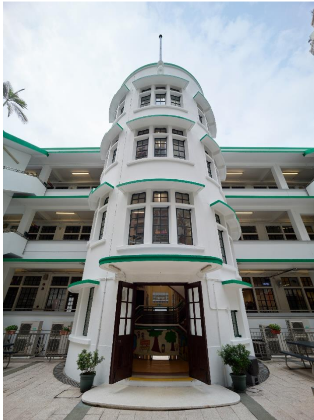
中央樓梯連弧形外牆，旗桿豎立於天台中央位置。