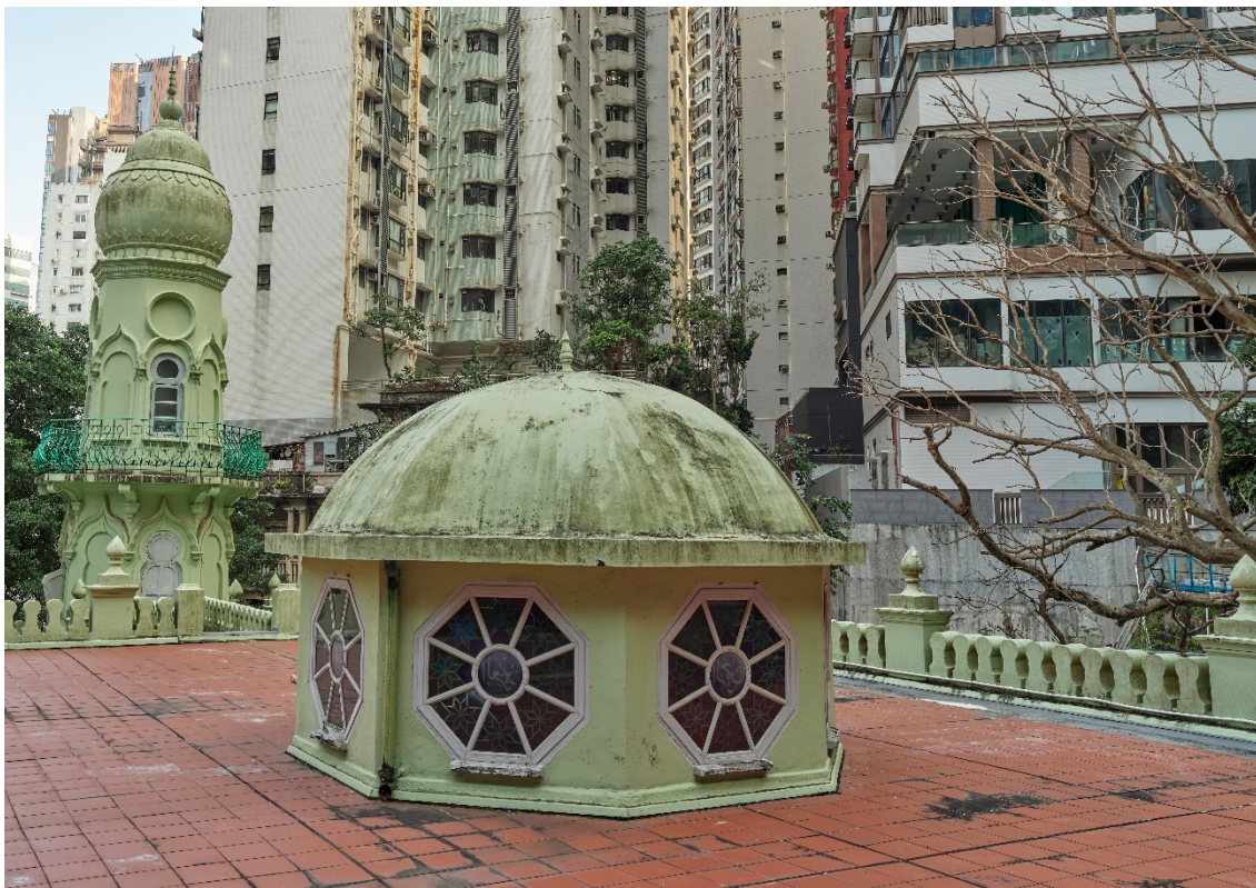
禮拜殿中央的八邊形圓拱頂連彩色玻璃窗。