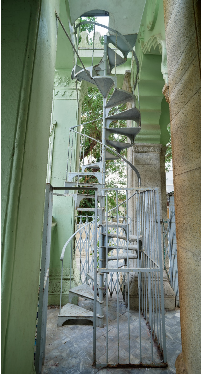
正門門廊角落處通往宣禮塔的金屬旋轉樓梯。