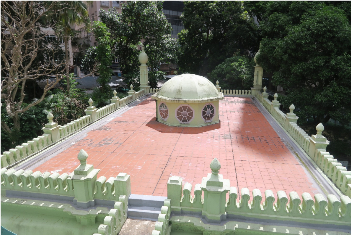
屋頂護牆飾有圓形城齒裝飾，每隔一段距離所設的座墩頂有尖飾。