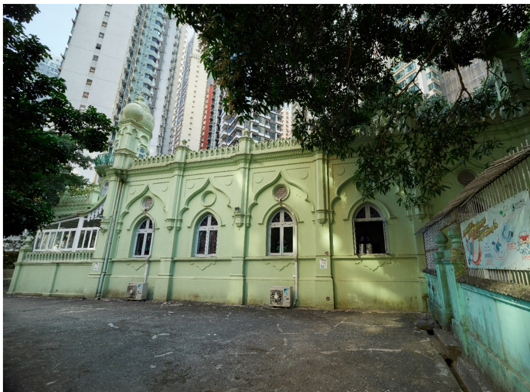
回教清真禮拜總堂側立面連尖拱窗戶及簡單圖案。