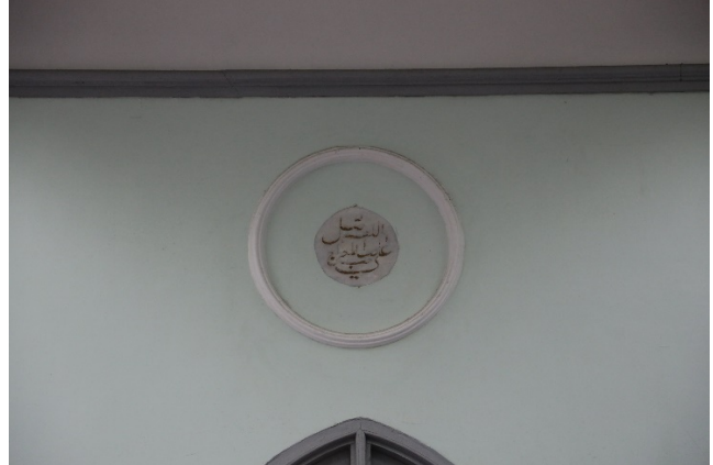
庫法體 ( Kufic ) 書法圖案在清真寺隨處可見。