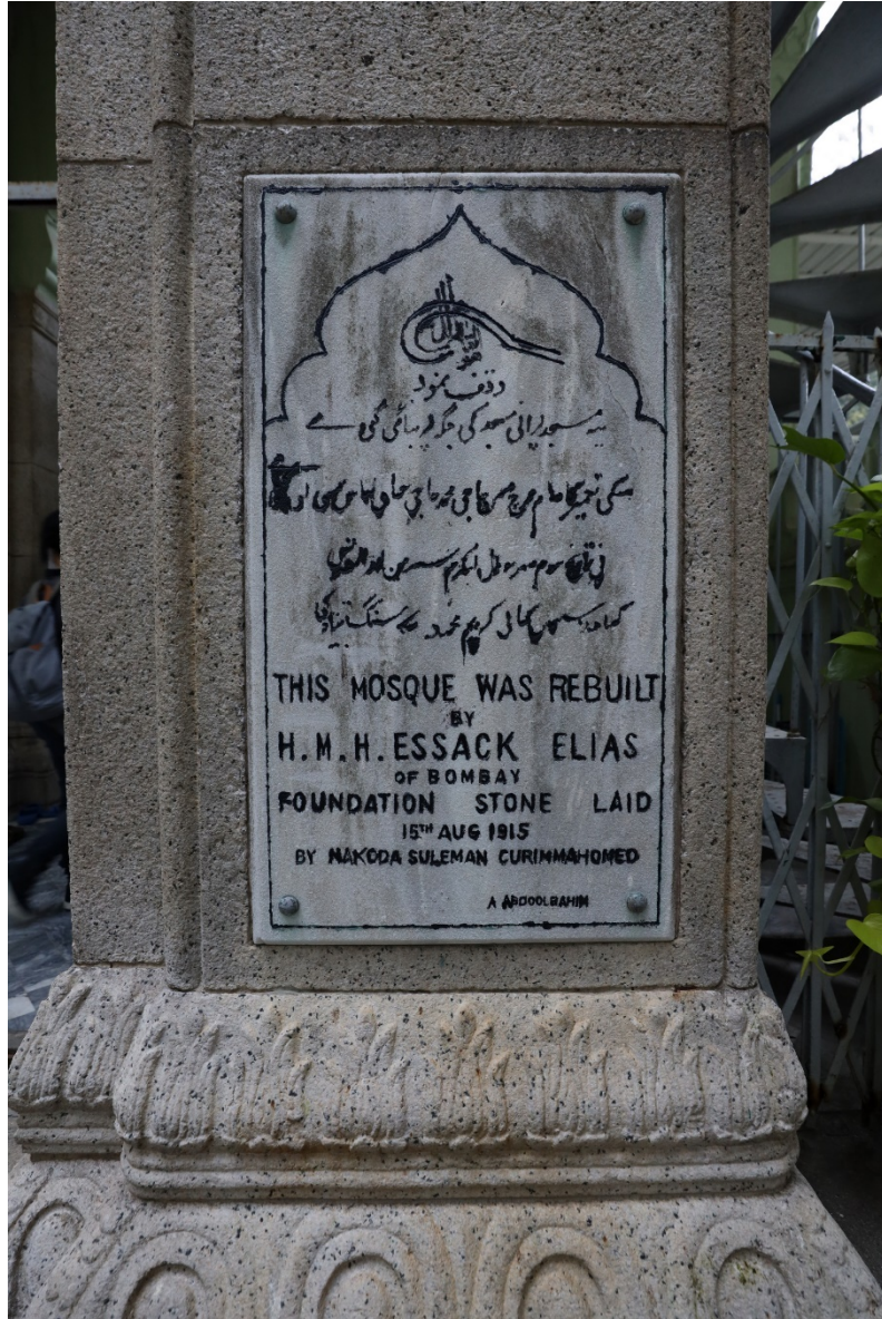
嵌在正門門廊花崗石柱的回教清真禮拜總堂奠基石。