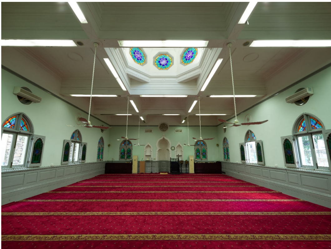
禮拜殿內部 禮拜殿兩側設有尖拱窗戶，窗葉嵌有多葉形尖拱彩色玻璃。