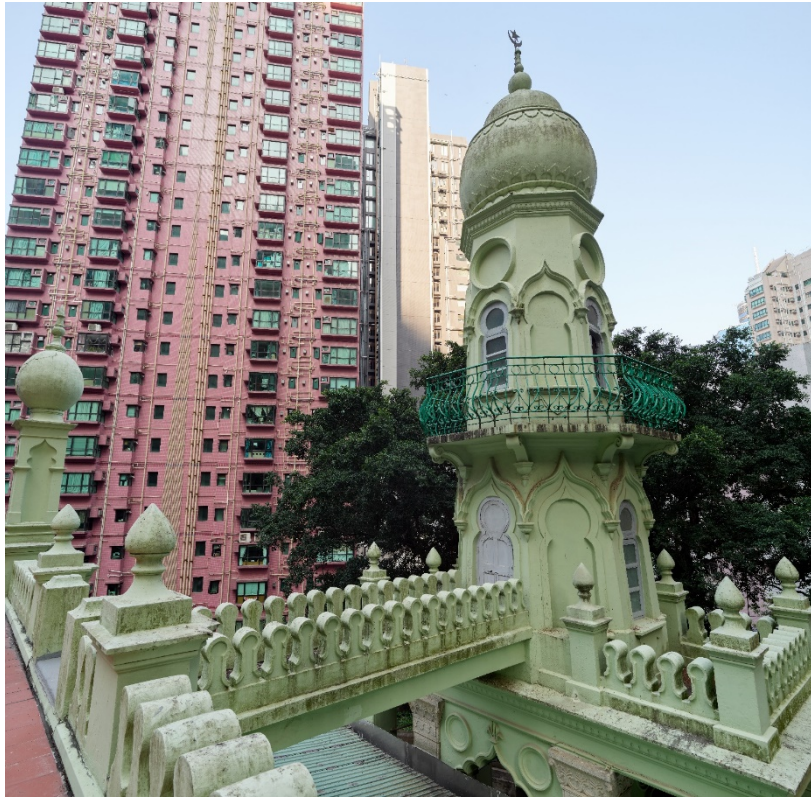
宣禮塔圓拱頂上有新月和星星標誌， 並有連接橋通往禮拜殿屋頂。