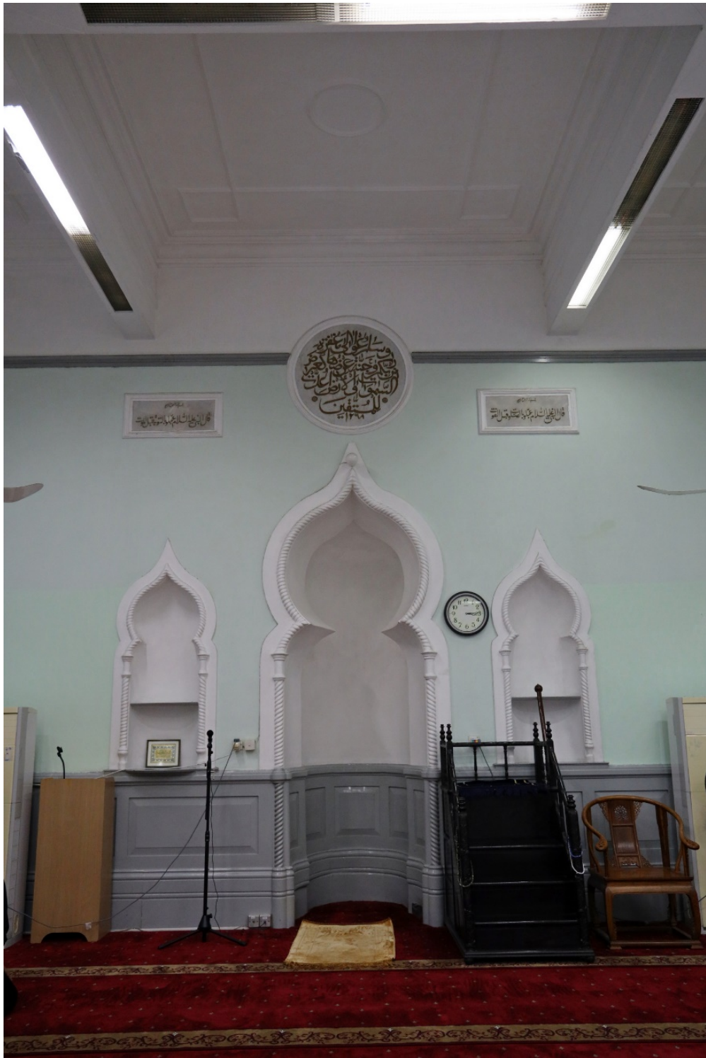
禮拜殿內的米哈拉布（ Mihrab ）洋蔥形尖拱開口 米哈拉布旁邊放有一張具百年歷史的木製宣講台（ mimber ）。