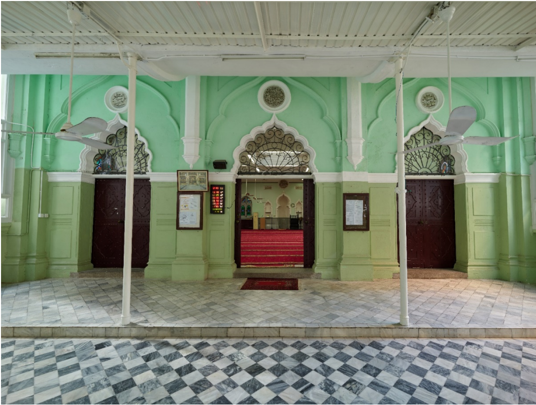
禮拜殿的三個多葉形尖拱門 入口門廊地面鋪有雲石地磚。