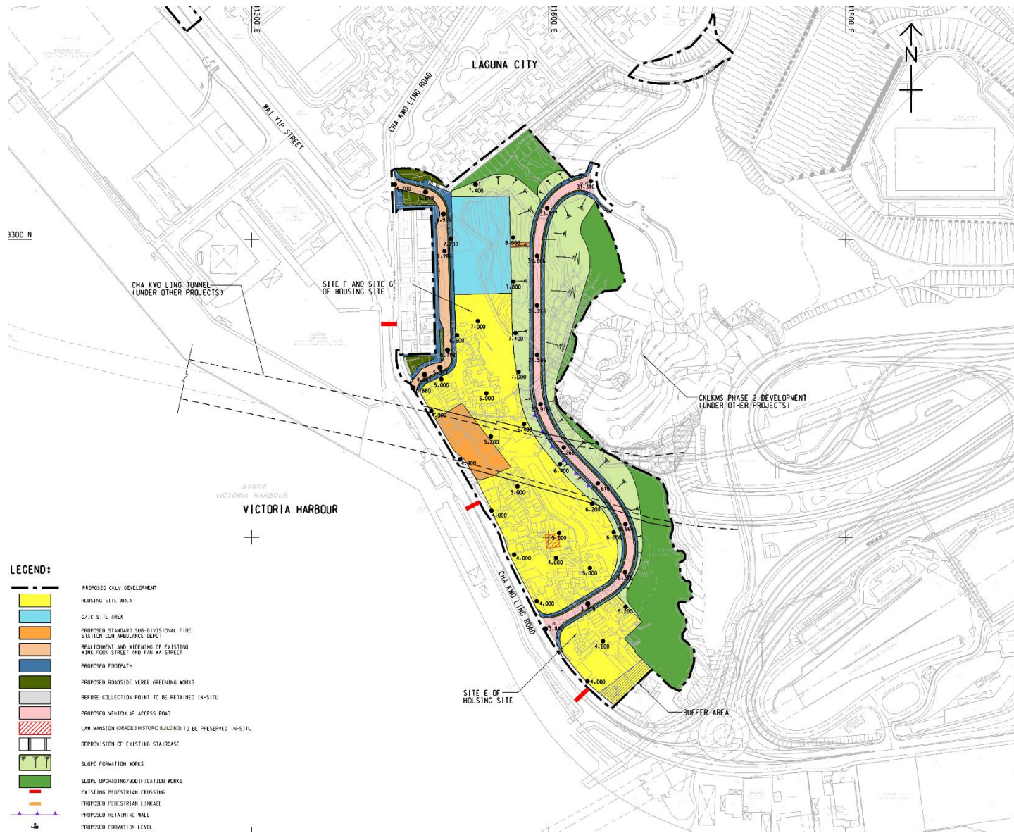
圖一 茶果嶺村發展計劃的位置圖