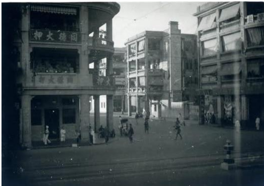
同德大押最早期的照片

1931 年有 Raven & Basto Architect 公司印及建築師簽名的地契顯示軒尼詩道 369-371 號應始建於 1931 年；而土地登記冊亦顯示，於 1934 年有一項叫 verandah undertaking 的資料，表示該建築物應已經建成。其後，從 1938 年起曾租給一名叫 Li Yau Tsun 的太平坤士，就是香港早期的華人知名企業家李肇源（號右泉）。其後，該物業於 1947 年再由典當業大王高可寧所創立的德成置業有限公司購入。 1 從 1948 年的香港年鑑可找到同德押的紀錄，表示同德押至少於 1948 年或以前已經開業了，比起坊間所說的 1954 年實應至少早 6 年。 2 而網上流傳一張據為 30 年代的相片，相中的馬師道入口唐樓已為同德押，當時上層的遊廊還未被圍封，可見的確為同德大押最早期的相片。李右泉在香港早期的業務以開設當舖為主，堪稱為香港典當業一哥，或有可能同德押最初是由李右泉開設，其後再賣給高氏家族也不定。無論是李右泉或是高可寧最先開設，前者是香港典當業一哥，後者則是澳門典當業大王，同德大押的經營者身分極其顯赫，這是無容置疑的。 3 高氏家族在香港所屬的大押，現存的就只有中環的德榮大押、深水埗的南昌大押（前同安大押）、佐敦德生大押及灣仔這幢同德大押。而四幢大押中，則以同德大押的規模最大。據說凡屬於高氏的大押，其招牌上均會有「囍」字；而同德大押招牌上的「囍」字，正正就印證了這事實。