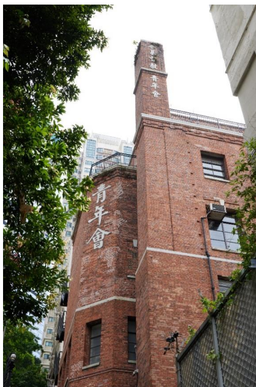
從樓梯街望向中央會所的側立面和背立面， 基督教青年會的中文名稱設於大樓的顯眼位置。