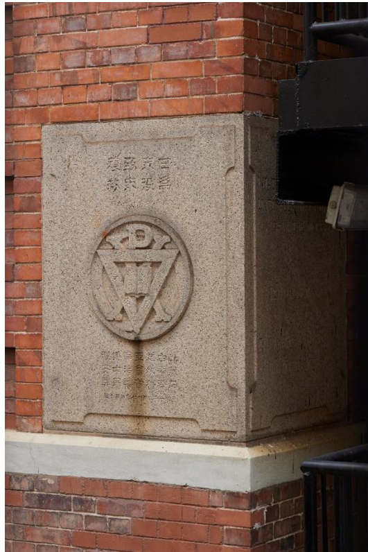
置於中央會所正立面的奠基石