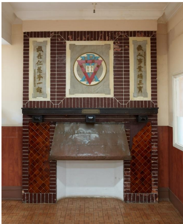
位於大樓地下的壁爐， 爐架上方的雲石板上有基督教青年會會徽和對聯。