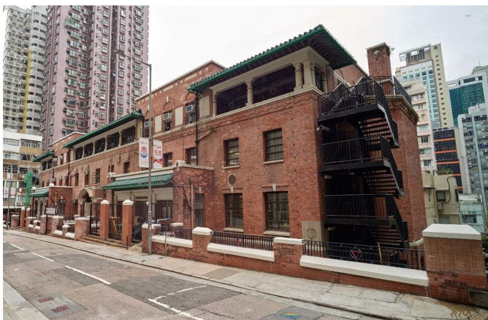
中央會所正立面的托斯卡納式圓柱和綠色琉璃瓦屋簷