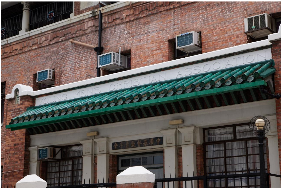
靠近水池巷的入口門廊上方刻有「基督教青年會」的英文名稱