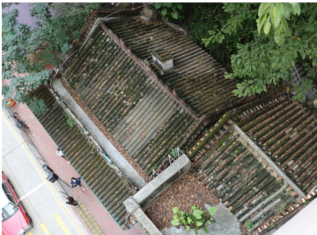
洪聖古廟鳥瞰圖，顯示一進三開間的布局，前設門廊。