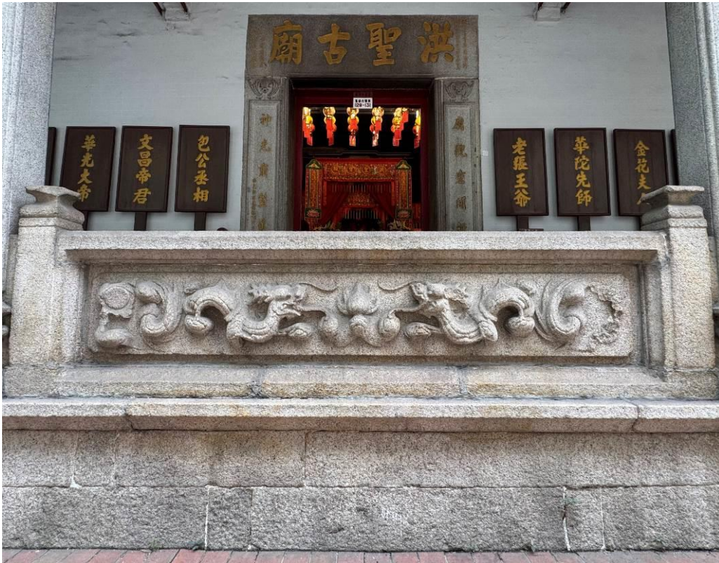
門廊中央的花崗石圍欄刻有精雕細琢的雙龍戲珠圖案。