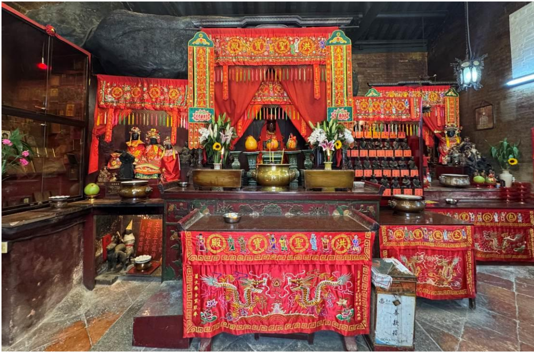
洪聖主神壇兩側分別供奉其他神祇，當中包括太歲、包公、金花夫人和花粉夫人。