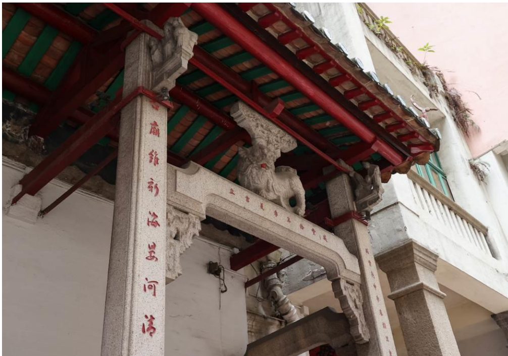
方形花崗石柱以「蝦弓樑」連接，樑上飾有雕工精細的花崗石隔架。