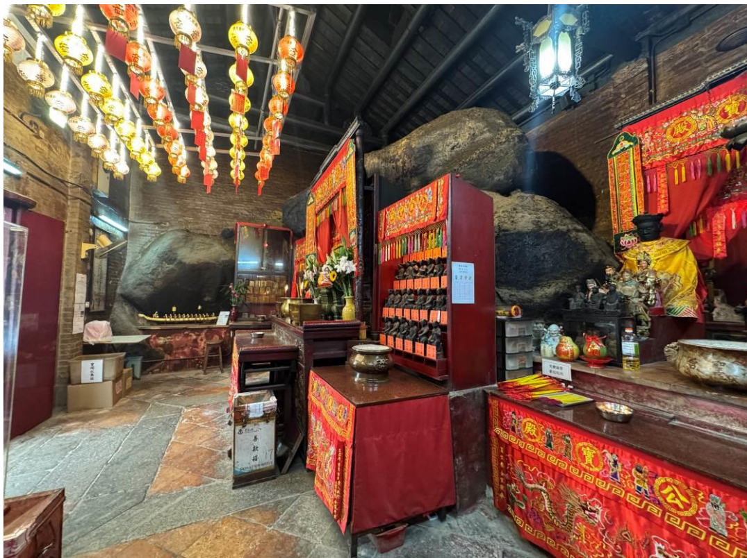
廟宇的東立面和背立面與天然岩石融為一體。