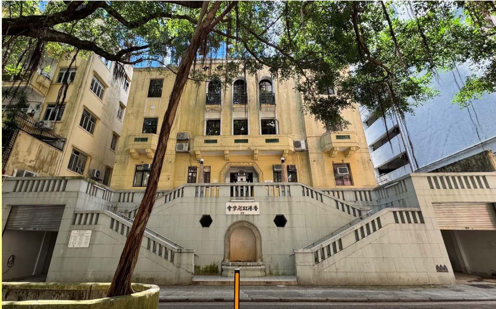
大樓正立面 Front elevation of the building