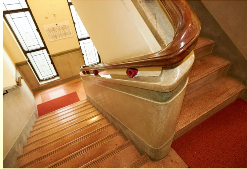
Main staircase 主樓梯