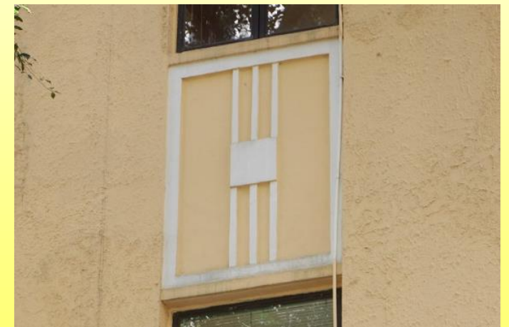
正立面的裝飾 Decorations at front elevation