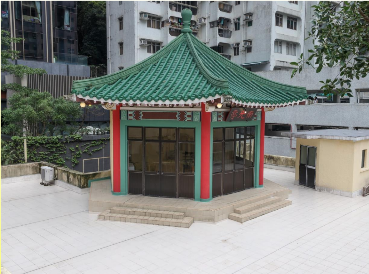
Nam Kwong Pavilion 南光亭