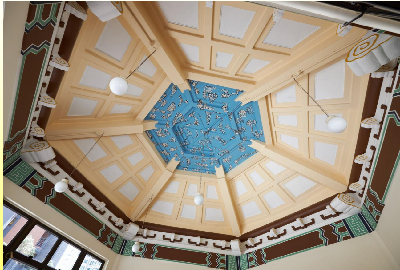
Ceiling of the pavilion 亭子的天花