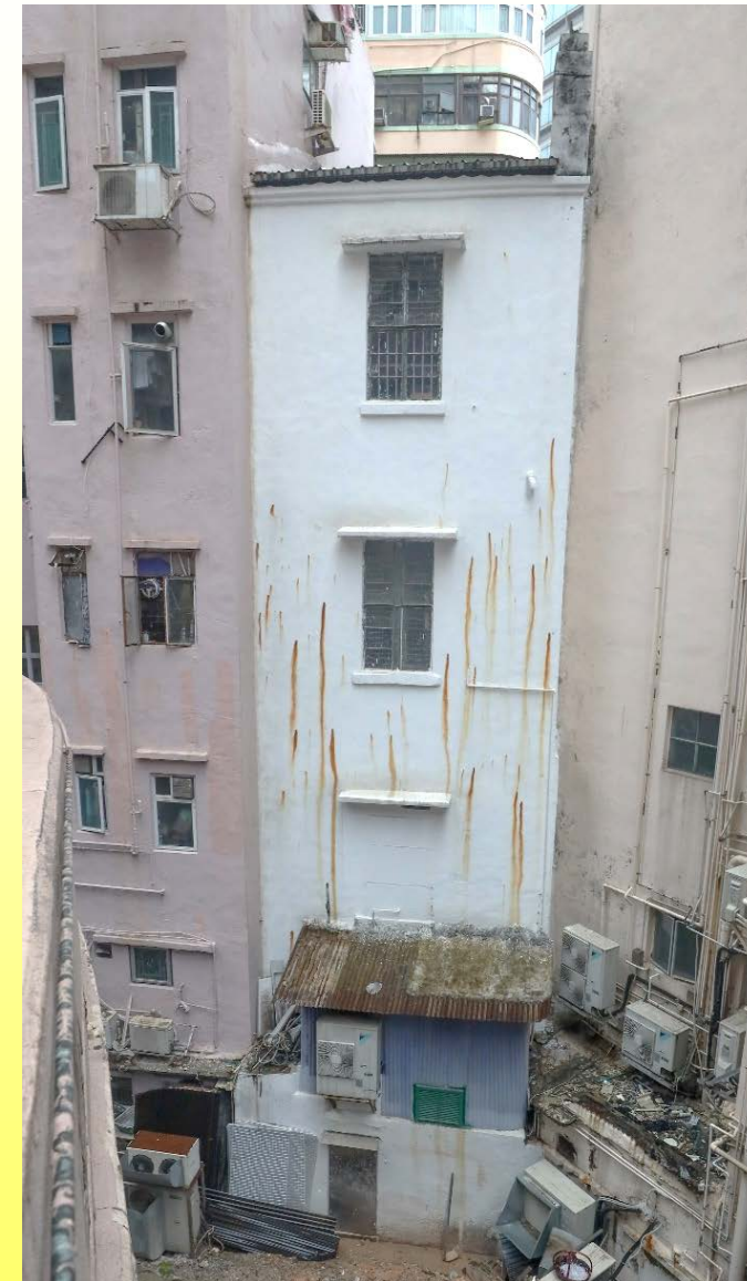
背立面 Rear elevation