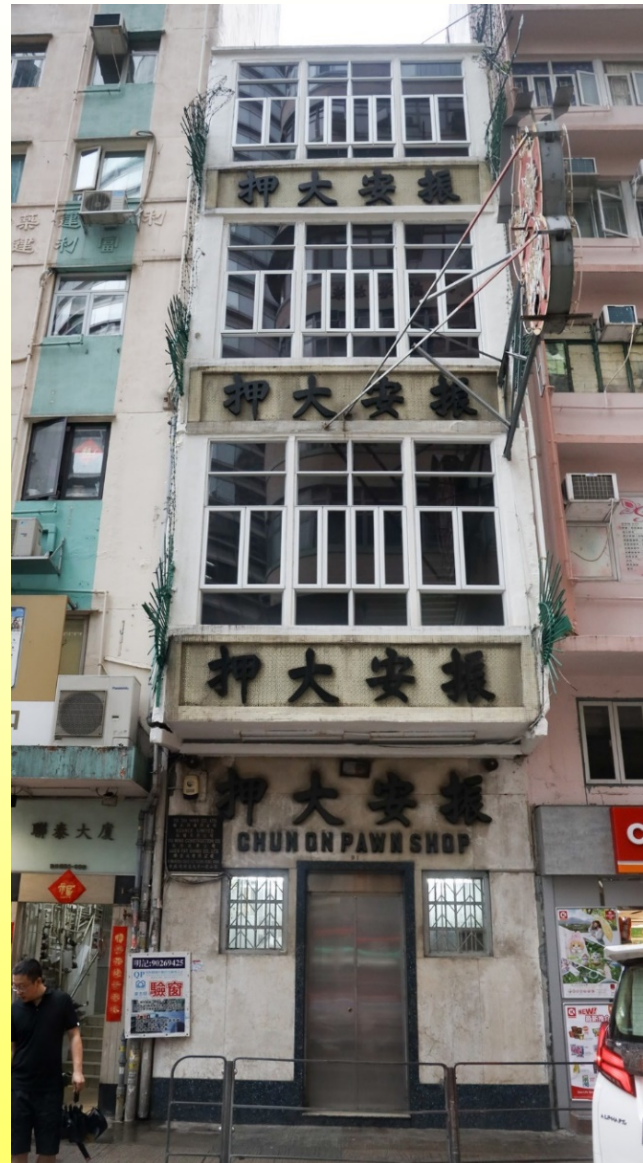
正立面 Front elevation