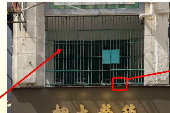
裝有綠色金屬欄柵的遊廊 Verandahs fitted with green metal grills