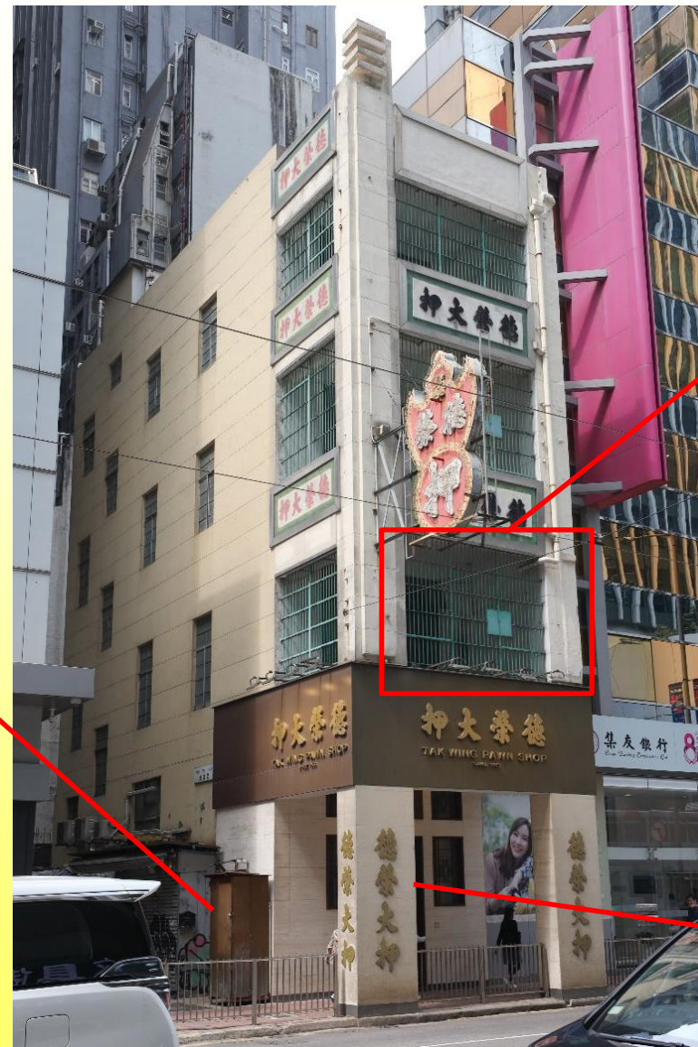
正立面及東南立面 Front elevation and south-east elevation