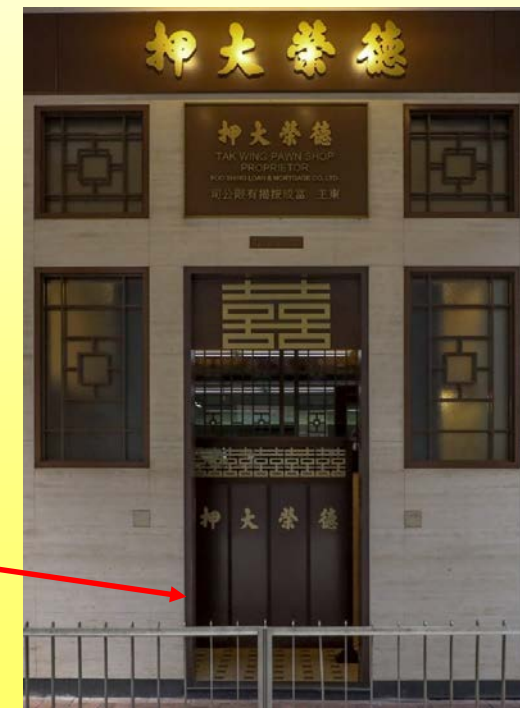
正門 Main entrance