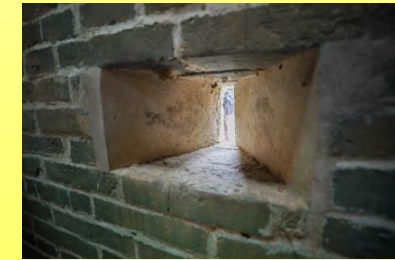
窗口及槍孔 Window openings and gun holes