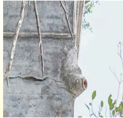
魚形滴水嘴 A fish-shaped gargoye