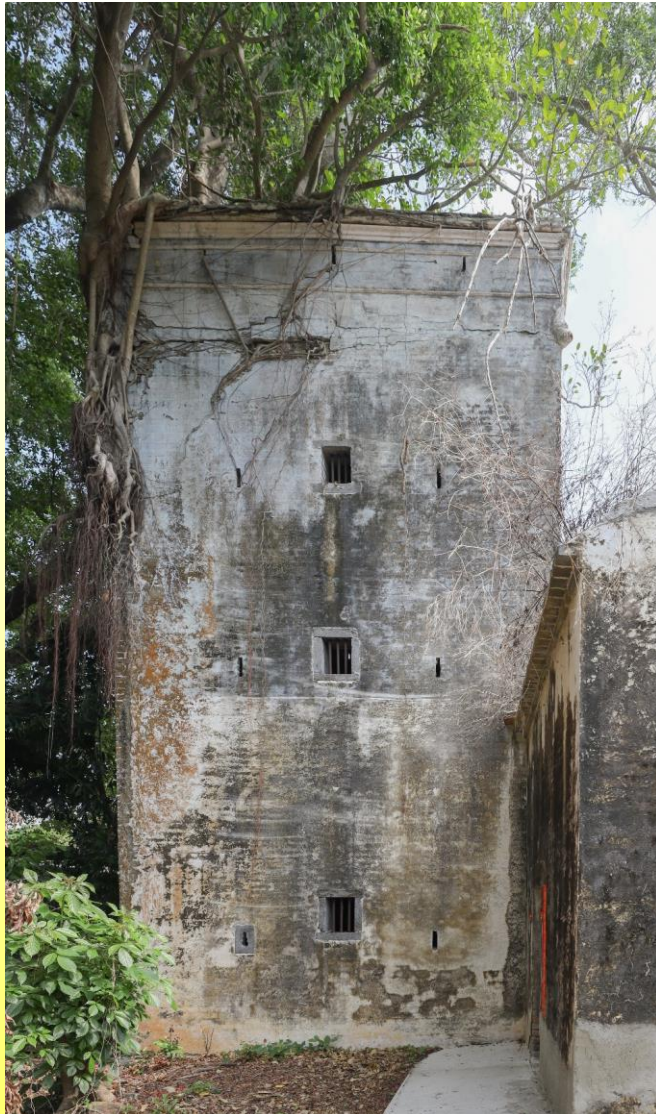
更樓外部 Exterior of the watchtower