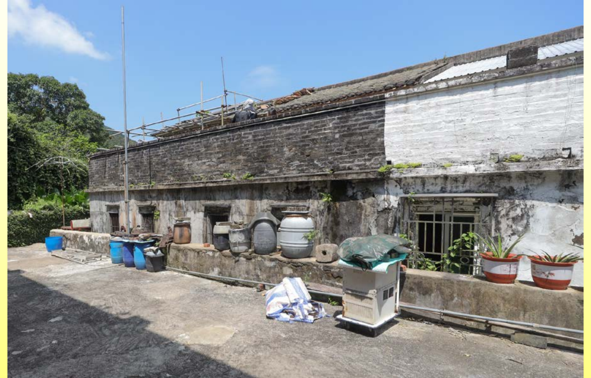
背立面 Rear elevation