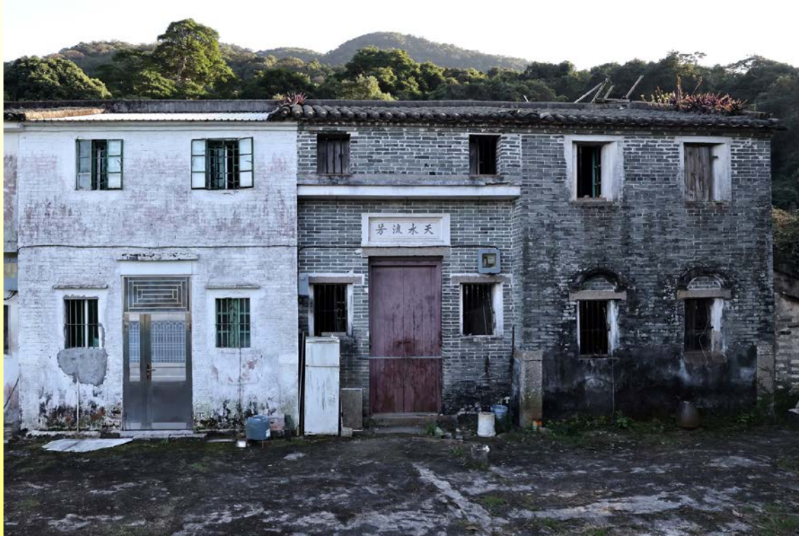
正立面 Front elevation