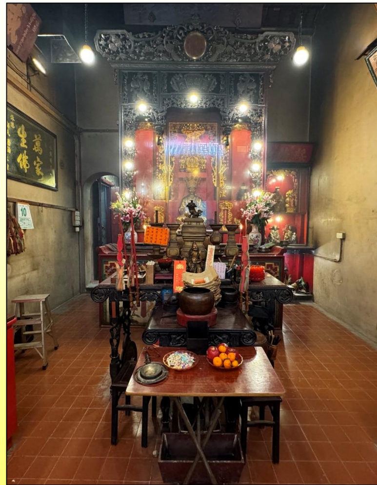
正殿 Sacrificial hall