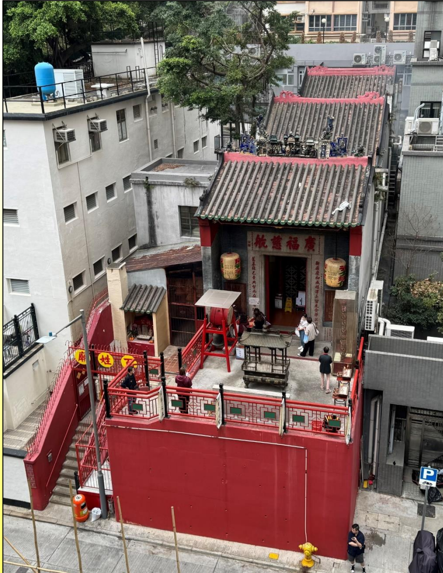
廣福祠外貌 General view of Kwong Fook Tsz