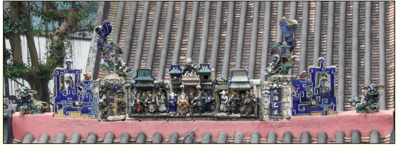
前進主脊上的石灣陶塑 Shiwan ceramics on the main ridge of the entrance hall