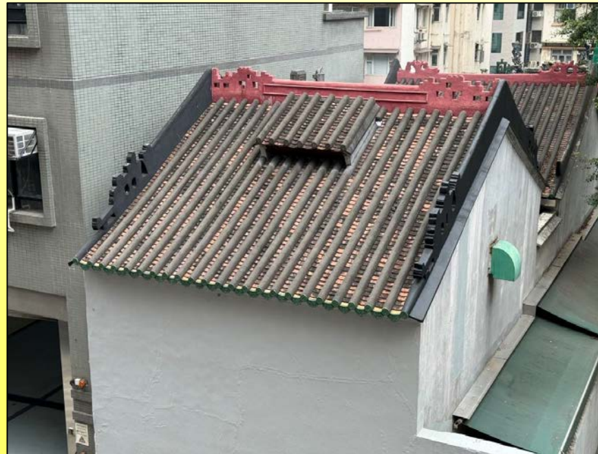
在後進正脊和垂脊的夔龍裝飾 Decorations in Kuilong motif on the main ridge and gable ridges of the end hall