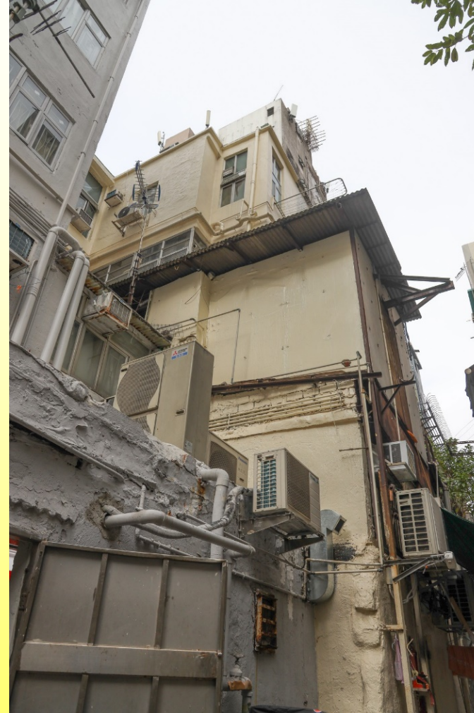
荔枝角道386號背立面 Rear elevation of No. 386 Lai Chi Kok Road