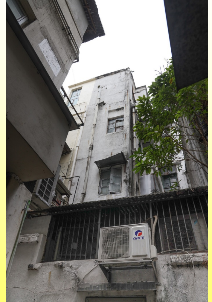
荔枝角道388號背立面 Rear elevation of No. 388 Lai Chi Kok Road