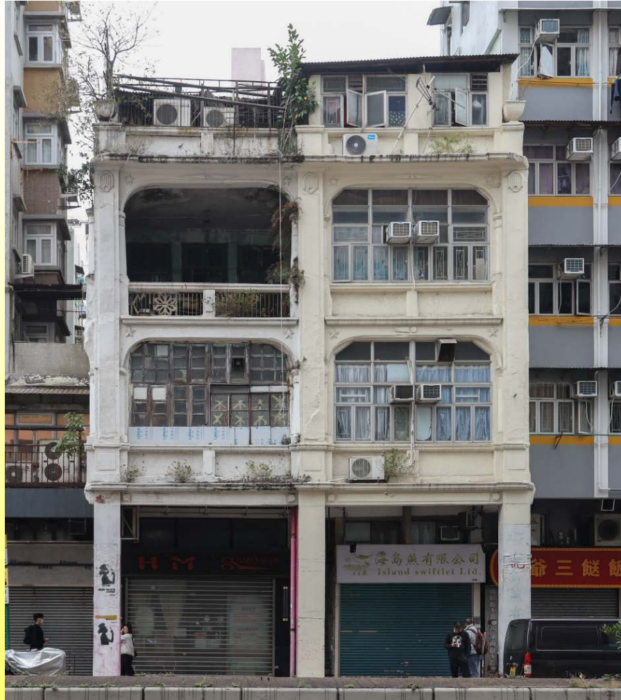
荔枝角道386及388號正立面 Front elevation of Nos. 386 and 388 Lai Chi Kok Road