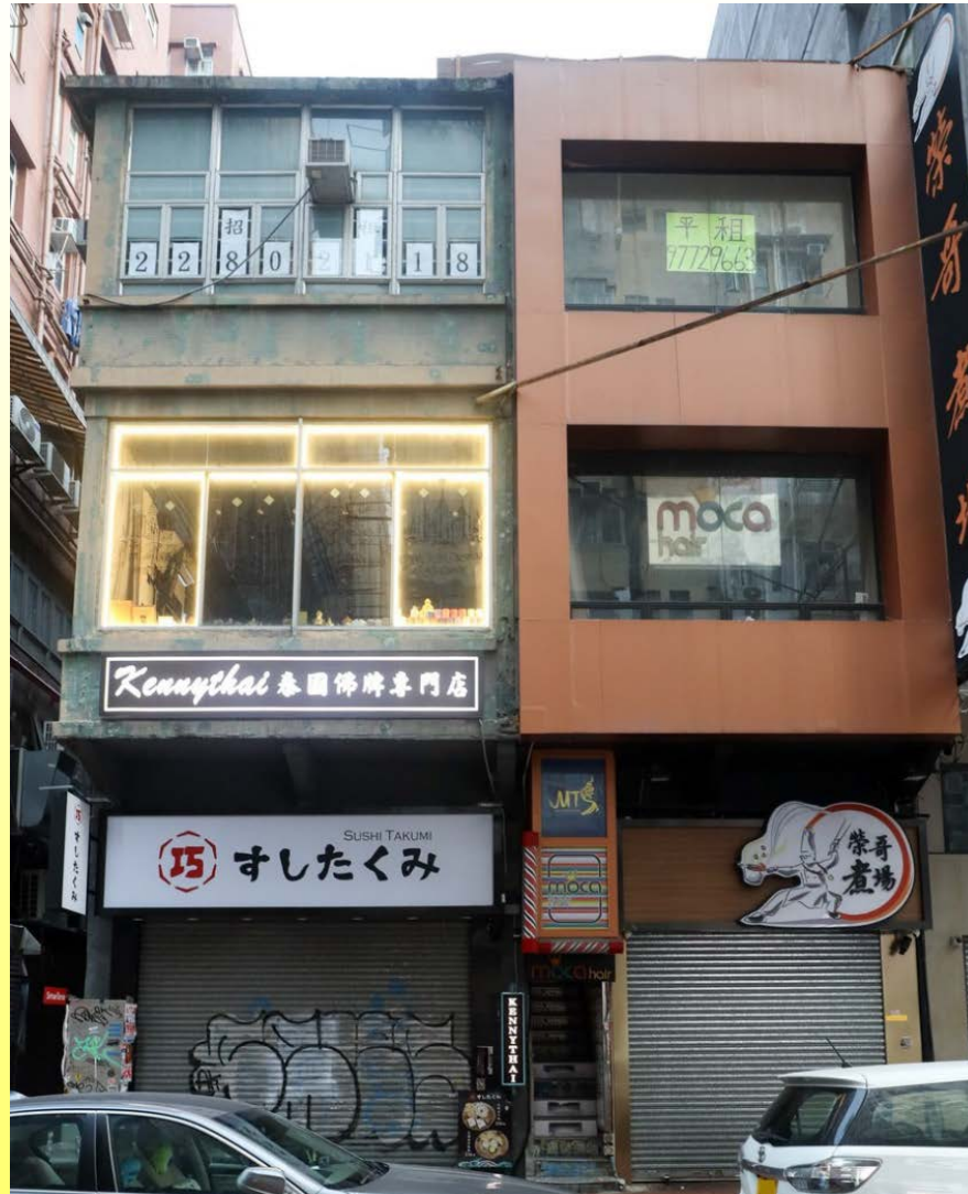
山東街53及55號正立面 Front elevation of Nos. 53 and 55 Shantung Street